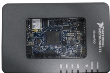
图 2 主控制器实物图

8. 主控制器如图 2 所示，直流供电范围为 6V~16V，易于上手使用、编程开发简单，板载资源丰富：共有 40 条数字 I/O 线，支持 SPI、PWM 输出、正交编码器输入、UART 和 I2C，以及 8 个单端模拟输入，2 个差分模拟输入，4 个单端模拟输出和 2 个对地参考模拟输出，方便通过编程控制连接各种传感器及外围设备；