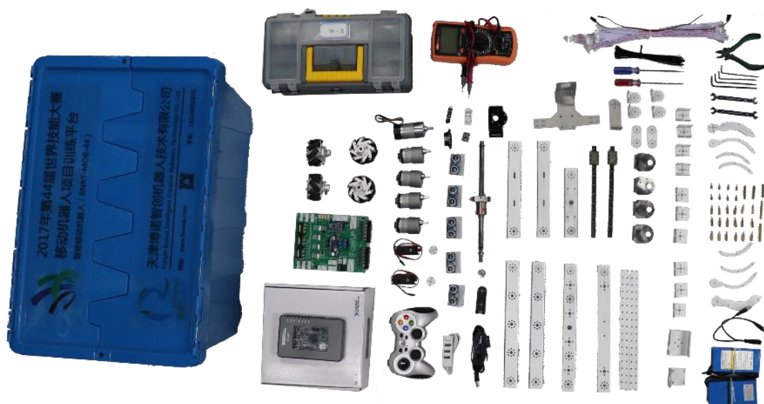
图 1 BNRT-MOB-44 型移动机器人套件