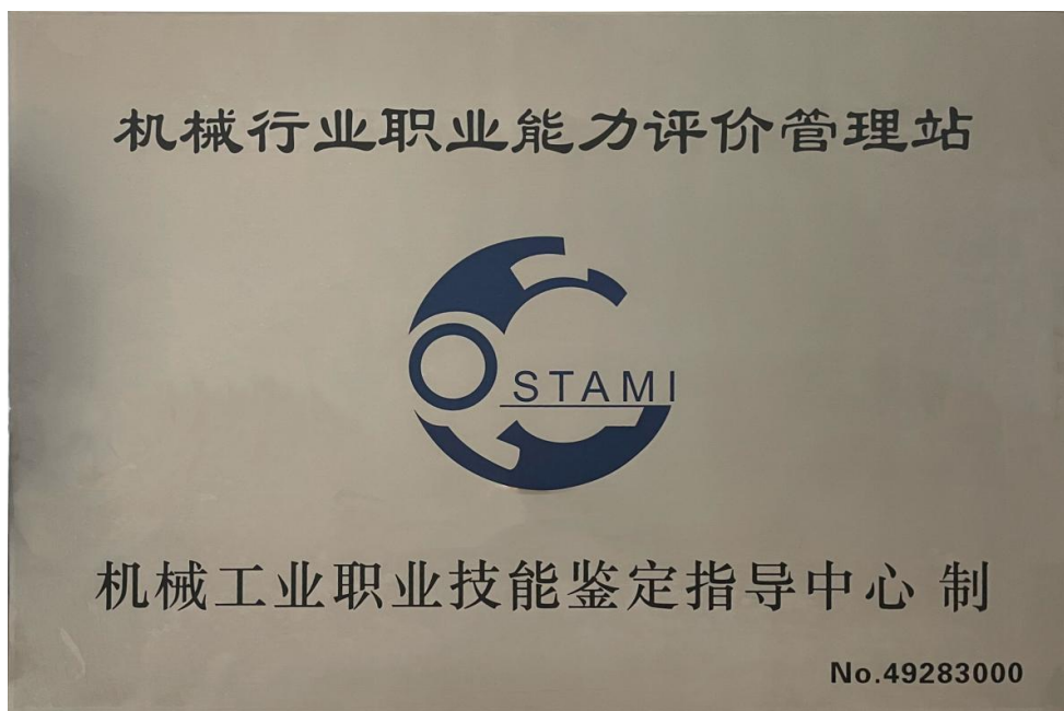
机械行业职业能力评价职教管理站铜牌

机械行业职业能力评价职教管理站（原机械工业职业技能鉴定职教分中心）是经机械工业联合会机械工业人才评价中心批复，负责开展机械行业职业能力评价等考务管理工作。机械行业职业能力评价职教管理站（机构编码：49283000）承建单位为北京企学研教育科技有限公司。