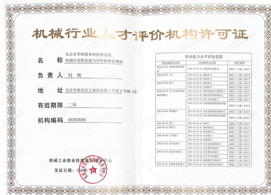
机械行业人才评价机构许可证